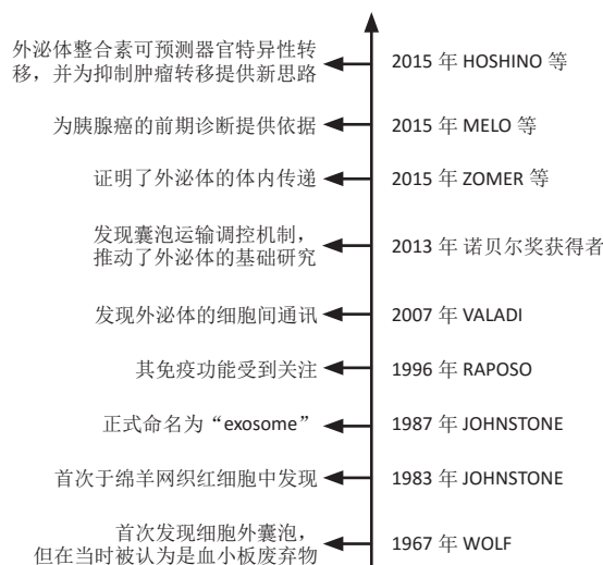
图 3 | 外泌体发现过程记时线图